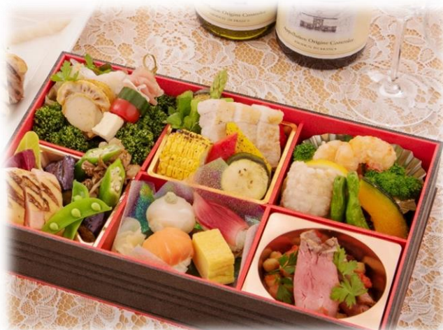
(宴席へパック膳で提供、会合後のお土産としても最適)