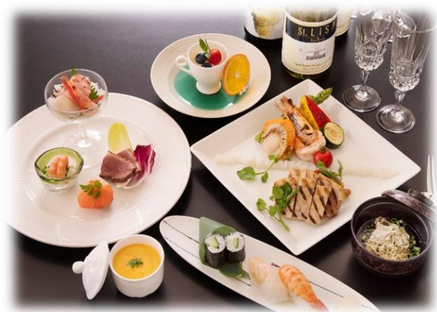
(お料理は写真の通りお一人盛で提供)